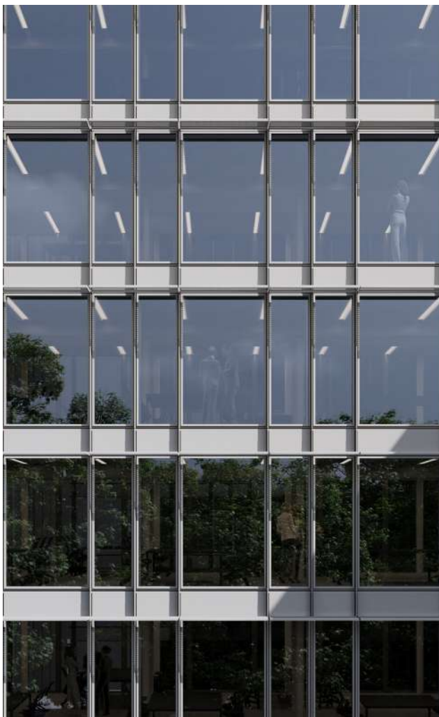
Facciata a sud con brise soleil di progetto