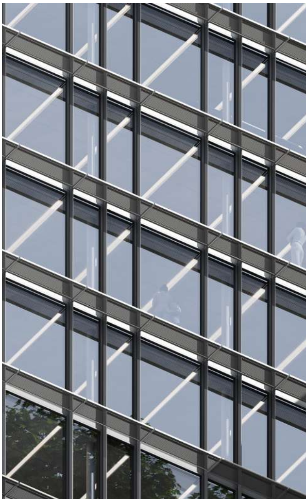
Facciata a sud con brise soleil di progetto