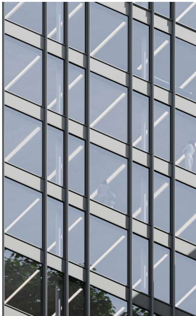
Facciata altri orientamenti di progetto