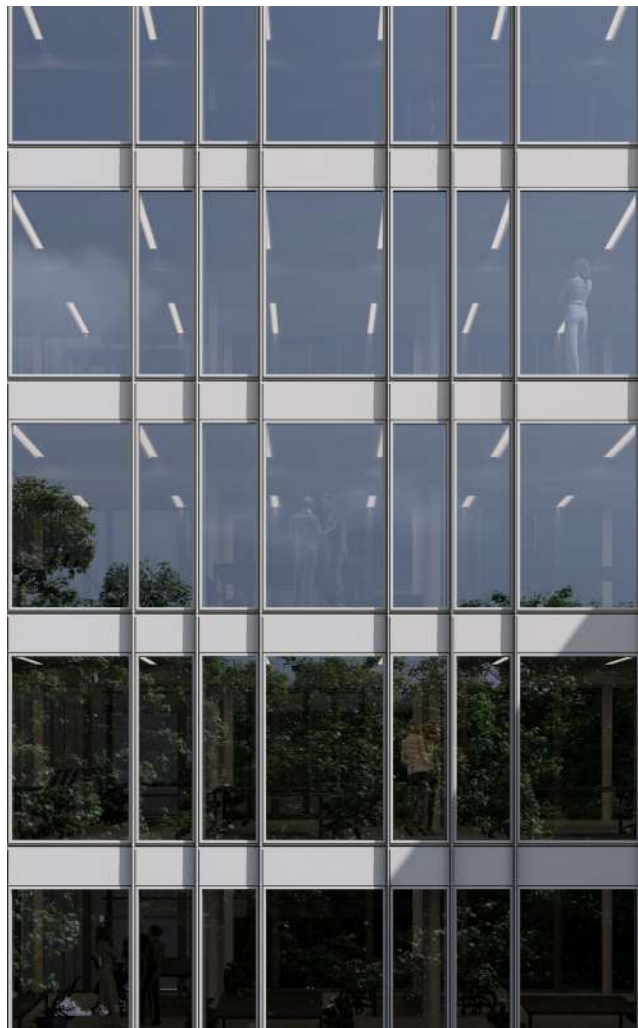
Facciata altri orientamenti di progetto