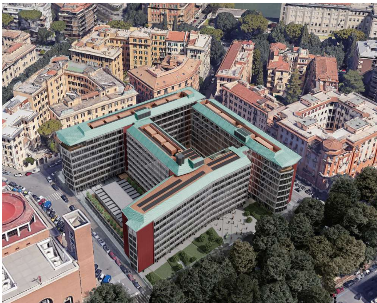
Vista aerea di progetto